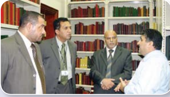
وفد مركز الإمارات للدراسات والبحوث الاستراتيجية

بهذه الكتب القديمة تحت اسم المجموعة الخاصة نظرا لندرته وأهميتها في غرفة مستقلة.