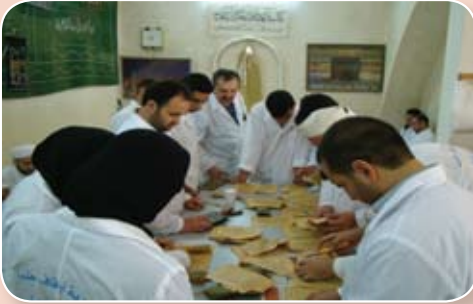
مجموعة من المتدربين

أنهى مركز جمعة الماجد في بداية الشهر الحالي تركيب معمل للترميم في المكتبة الوقفية بحلب. كان المركز قد تبرع به للمكتبة. ويتكون المعمل من أجهزة تصوير رقمي (كاميرا + حامل) عدد اثنين. وجهاز الماجد للترميم الآلي. والمعالجة الكيميائية. وحامل جفيف. ومواد لتجليد المخطوطات. ومكبس يدوي وخلاط.