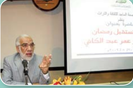
الدكتور عمر عبد الكافي

● ألقى فضيلة الدكتور عمر عبد الكافي المستشار الثقافي لجمعة الماجد صباح يوم الخميس 20/8/2009 محاضرة بعنوان (كيف نستقبل رمضان)، وقد أكد فيها على نقاط محددة. أهمها: البعد عن التلفاز فيما لا يفيد من مسلسلات وأفلام وتمضية الوقت سدى؛ لأن رمضان شهر العبادة وشهر القرآن، وأشار إلى عدم تحويل رمضان شهراً لزيادة الوزن والتنقل بين ألوان الحلوى، ونبه إلى أن على المرأة ألا تضع وقتها في المطبخ فقط. بل عليها الالتفات لعبادتها، وعلى الأزواج والأبناء إعانتها في ذلك، كما نبه الدكتور عمر إلى خطورة الغيبة والنميمة، وأنهما في ليل رمضان كنهاره، كما إنهما سواء في الإثم في رمضان وغيره.