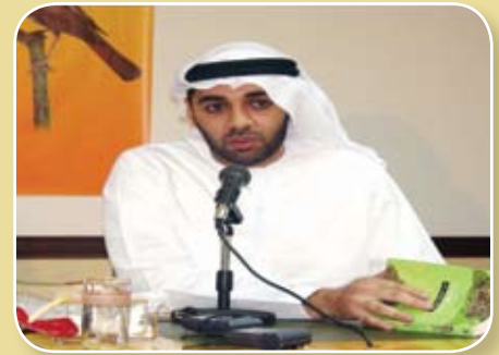
الشاعر علي الشعالي