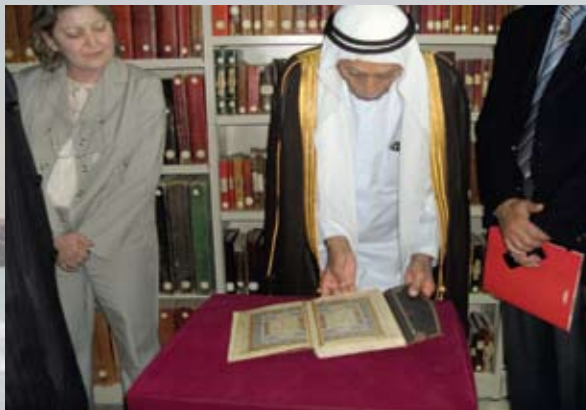
السيد جمعة الماجد أثناء اطلاعه على مخطوطات المكتبة الوطنية

كما هي تونس خضراء فإنها غنية بالثقافة والفكر والتراث. وضمن جولة السيد جمعة الماجد والوفد المرافق لدولة تونس الشقيقة قام بزيارة المكتبة الوطنية وكانت في استقباله مدير عام المكتبة الوطنية د. سامية قمرتي . وبدأ الوفد جولة في المبنى الجديد الرائع الذي شيد بعناية فائقة ومهنية عالية. وروعي في البناء كل الاحتياجات المكتبية التي تحتاجها المكتبات من قاعات مطالعة واسعة وأجهزة حاسوب للمراجعين وقاعات خاصة لطلبة الدراسات العليا وكبار الباحثين. وبدأت جولتنا في قسم المخطوطات الذي أودع فيه 28000 مجلد أي ما يعادل 45000 عنوان. حفظت في خزائن أمينة محكمة. روعي فيها كل الاحتياجات اللازمة للحفظ المثالي. وتم الاطلاع على جزء من نوازل هذه المخطوطات. كما تمت زيارة مركز الترميم الذي أسسته المكتبة وفق معايير خاصة وبالتعاون مع جهات فنية مختصة. وتم التفاوض والنقاش بين الوفد ومسؤولي الترميم حول أفضل أسس عملية الترميم وتم الاتفاق على تبادل الزيارات من أجل تبادل الخبرات في هذا الموضوع. كما تمت زيارة قسم الرقمنة في المكتبة. وتم الاطلاع على التقنية المستخدمة في التصوير الرقمي . كما شرح لنا المسؤولون الخطوات التي تتم بها عملية التصوير كما تمت رؤية أحدث الأجهزة المستخدمة في ذلك. وتم التفاوض مع د. سامية قمرتي حول إمكانية المكتبة في التعاون مع المركز في مراجعة وتدقيق واصفات اللغة الفرنسية ضمن مشروع الكنز العربي الموحد الذي يقوم المركز بتطويره بالتعاون مع مكتبة عبد الحميد شومان ومكتبات بلدية دبي. وأبدت د. سامية استعداد المكتبة للتعاون في هذا المشروع القيم كما وصفته. وفي نهاية الزيارة ودعت د. سامية قمرتي الوفد بحفاوة وكرم ضيافة بعد أن سجل السيد جمعة الماجد كلمة في سجل الزوار .