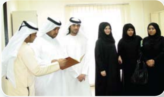
وفد من زيارة محاكم دبي فريق عمل الهوية الوطنية 23 - 7 - 2009