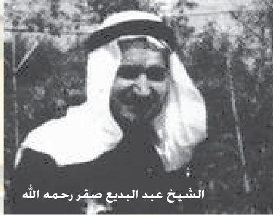
الشيخ عبد البديع صقر رحمه الله

أخيراً ما أجمل أن يتقارب الحاكم من المحكوم والقائد من العالم لتكون بذلك منظومة مجتمعية متميزة. رحم الله الشيخ زايد. فلم يكن حاكماً فحسب بل كان مدرسة للحكام ومصدراً للإنسانية وحب الخير والحرص عليه .