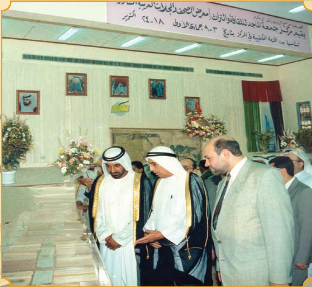
الشيخ أحمد بن سعيد آل مكتوم في افتتاح معرض الصحف والمجلات 1993م