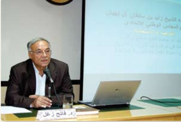
الدكتور فاضل زغل

بالمجلس والتي منها: حرص سموه على حضور جلسات افتتاح الدورات العادية للمجلس، ومشاركته في المناقشة مع الأعضاء في بعض الجلسات، واجتماع سموه مع أعضاء المجلس بعد كل جلسة يحضرها، والتحدث إليهم والاستماع إلى قضاياهم، واستقبال سموه للجان الرد على خطاب الافتتاح في كل دورة جديدة، واستقبال الوفود البرلمانية التي كانت تخرى إلى البلاد، ومتابعة أخبار البرلمانات العربية حيث يبدي ملاحظاته وتوجيهاته.